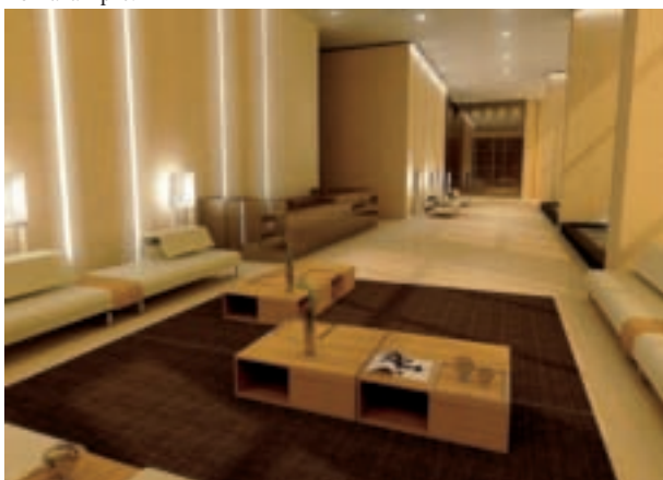
На этой странице, туалет и jacuzzi Группы Feg. На странице справа, коридор, умывальник «Рапсел» и лампа «Айвори» от Фонтана Арте.

venti piani di design e tecnologia, ma anche ecologia ed innovazione tutte italiana. "PIER 24" – che ver-