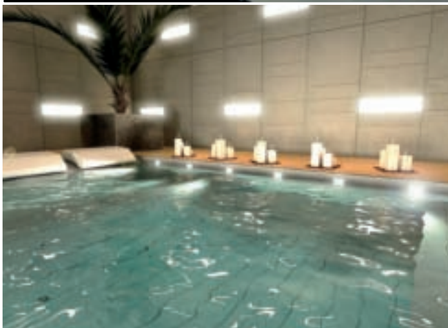
THIS PAGE, GRUPPO FEG KITCHEN CUPBOARD, THE LOBBY BATHROOM, THE JACUZZI AND THE LOBBY. RIGHT PAGE, A HALLWAY, A RAPSSEL SINK AND FONTANA ARTE'S IVORY LAMP.